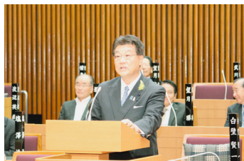
9月定例会にて質問中