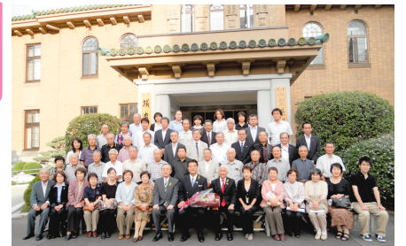
9月27日 議会傍聴いただいた皆様