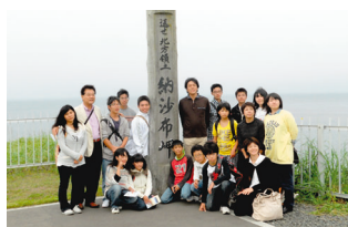
8月19日 納沙布岬にて歯舞群島を望む（根室市）