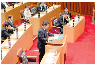
質問風景を上から