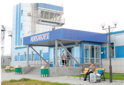
9月14日 国後島・メンデレエフ空港（新装）

9月13日から17日ビザ無し交流で北方領土（国後島、色丹島）を訪問。訪問は20年間で、今回4回目となる。14日に国後島に上陸、15、16日は色丹島へ訪問いたしました。