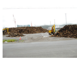
未だにガレキが残る市内