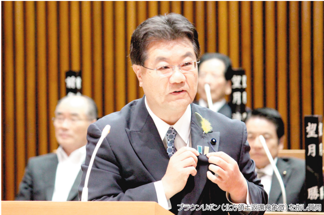
ブラウンリボン(北方領土返還の象徴)を指し質問