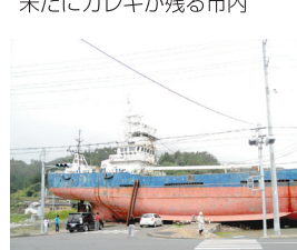
道路を塞いだままの大型漁船