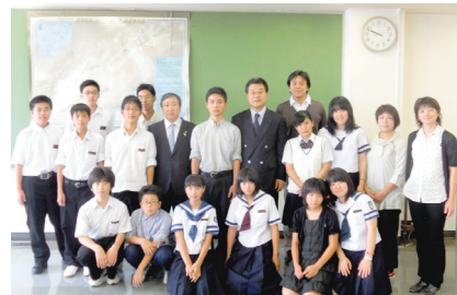
8月20日 根室市長を表敬訪問