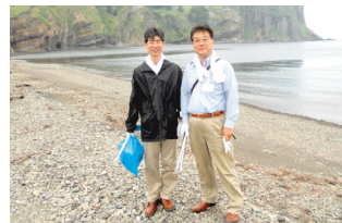
9月15日 園田大臣政務官（当時）と