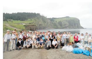
9月15日 色丹島・ゴミ拾いを終えて（斜古丹湾近く）