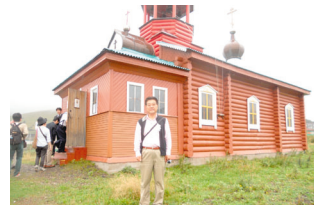
9月16日 色丹島・ロシア正教会前