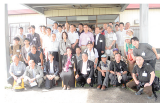
9月14日 国後島・友好の家（ムネオハウス）