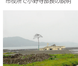
陸前高田市の根性の一本松