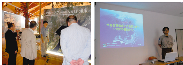
8月28日 知床遺産センター