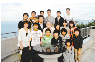
8月17日 羅白展望台から国後島を望む

8月17日から20日まで北方領土青少年現地視察事業（山梨県）の小、中、高生14名を含む総勢20名の団長として羅白町、根室市を訪問。間近に国後島、歯舞群島を見ました。