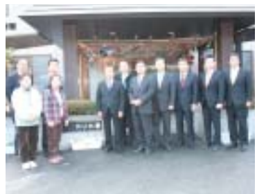
1月17日。身体障害者支援施設かじか寮を視察(身延町)