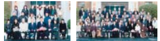
2月29日議会傍聴いただいた皆様（1班、2班）