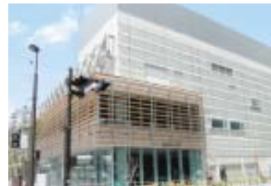
県立図書館外観(甲府市、4月現在)

念願の県立図書館が本年11月11日オープン予定となりました。建物本体は完成し、現在は書棚等の搬入作業等をしております。