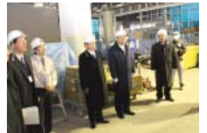
1月17日 図書館内部視察