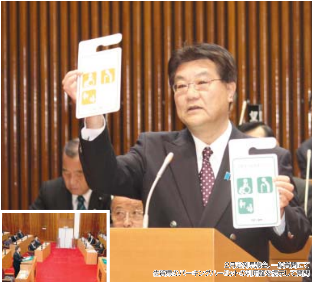
2月定例県議会、一般質問にて 佐賀県のパーキングハーミットの利用証を提示して質問