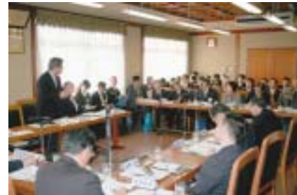
2月定例会。教育厚生委員会で中高一貫校の是非について発言する。