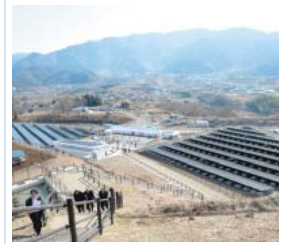
広大な土地に設置されたソーラーパネル

甲府市下向山地内にて、稼動している米倉山のメガソーラー。一般家庭で実に3,400軒分の年間使用量を発電できる大規模な太陽光発電所。(1月27日完成式)