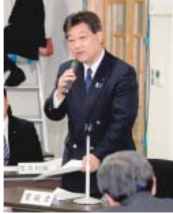
山田一功オフィシャルホームページより動画でご覧頂けます。